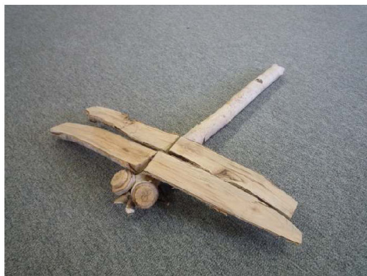
しらかばで作った 昔トンボ